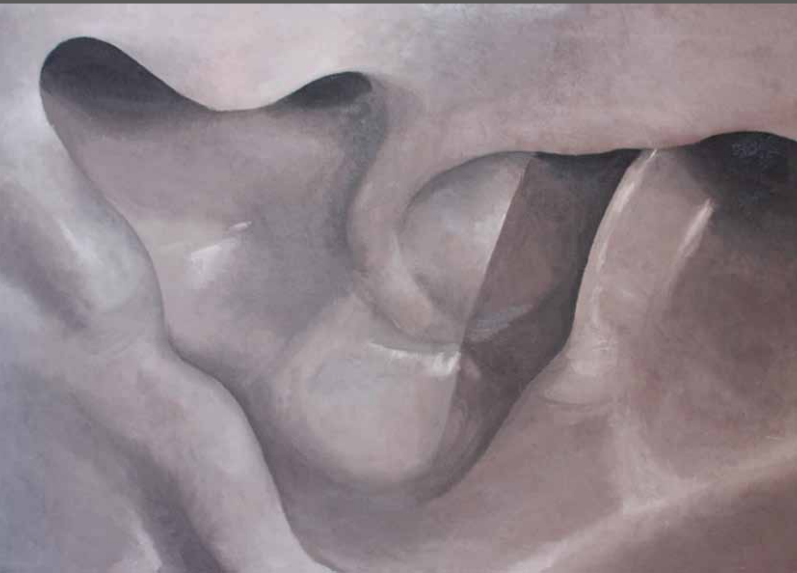
FRAGMENT III, 2016, huile sur toile, 60 x 90 cm