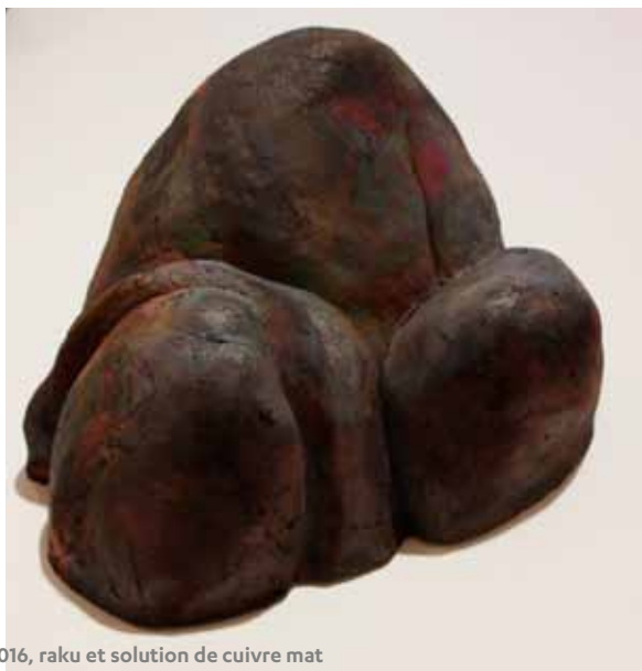
FRAGMENT I-III, 2016, raku et solution de cuivre mat