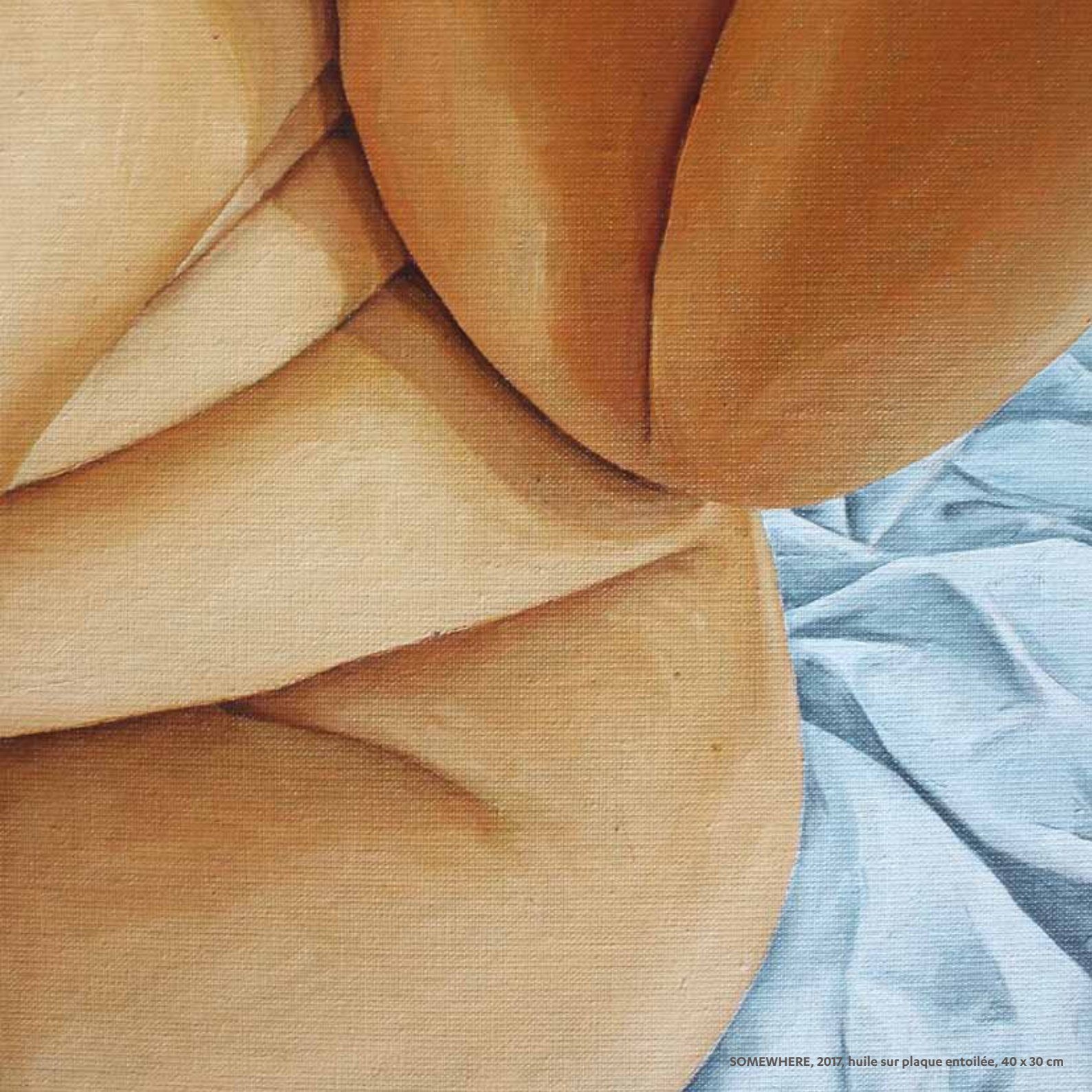
SOMEWHERE, 2017, huile sur plaque entoilée, 40 x 30 cm