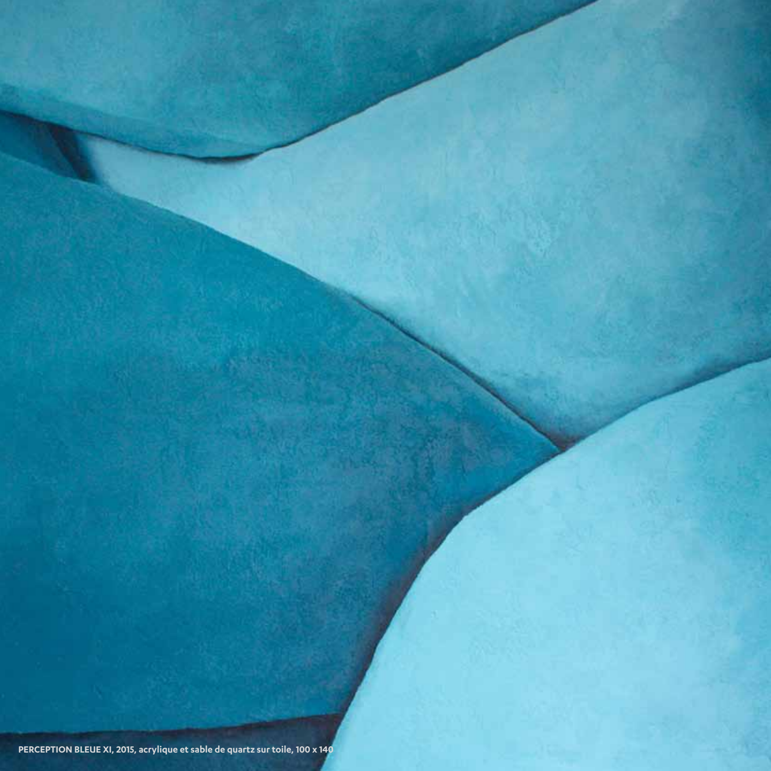
PERCEPTION BLEUE XI, 2015, acrylique et sable de quartz sur toile, 100 x 140